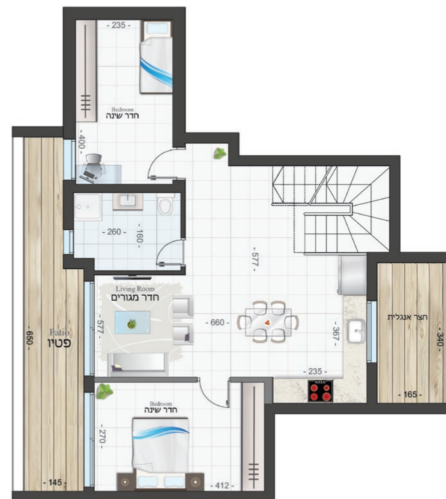
אופציה 1 קומת מרתף: 68.49 מ"ר פטיו: 12.37 מ"ר | חצר אנגלית: 6.72 מ"ר