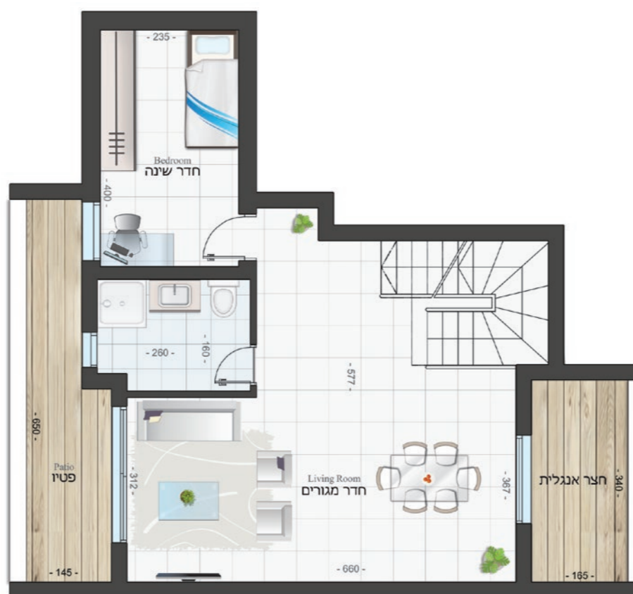
אופציה 2 קומת מרתף: 58.65 מ"ר פטיו: 9.07 מ"ר | חצר אנגלית: 6.72 מ"ר